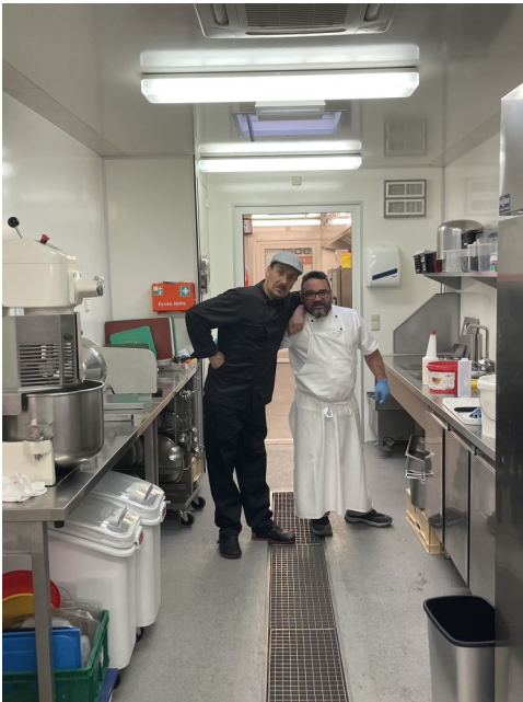
Die Container sind eingerichtet

Wie Sie sicher am Baulärm feststellen konnten, schreitet unsere Küchensanierung gut voran. Diese Woche ist es eher ruhig, denn der Verputz muss trocknen. Voraussichtlich können wir sogar die Bauzeit verkürzen. Wenn alles klappt, ist Mitte Juni alles wieder wie früher!